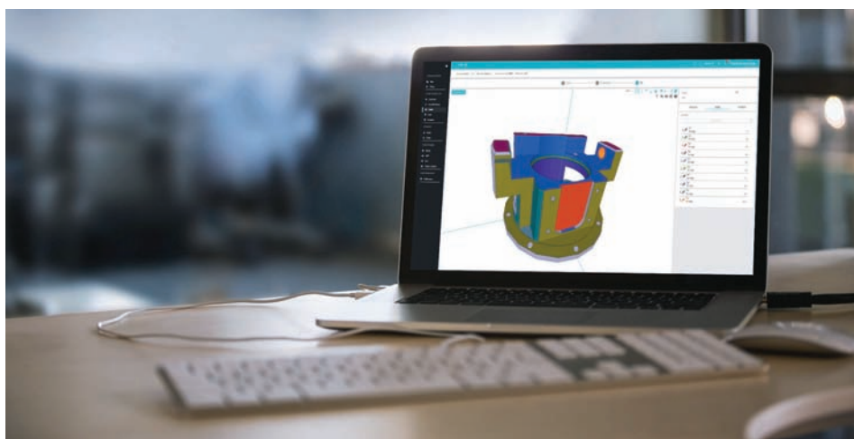
► Ellistat a remporté le Trophée de l'Innovation pour cette évolution de l'APC « Configuration Auto 3D »

Récompensé pour l'évolution APC « Configuration auto 3D », l'éditeur de logiciels a reçu le Trophée de l'Innovation dans la catégorie « Logiciels » du salon industriel Simodec 2020 (reporté en mars prochain). Cette innovation permet de configurer APC directement à partir du fichier CAO 3D de la pièce.